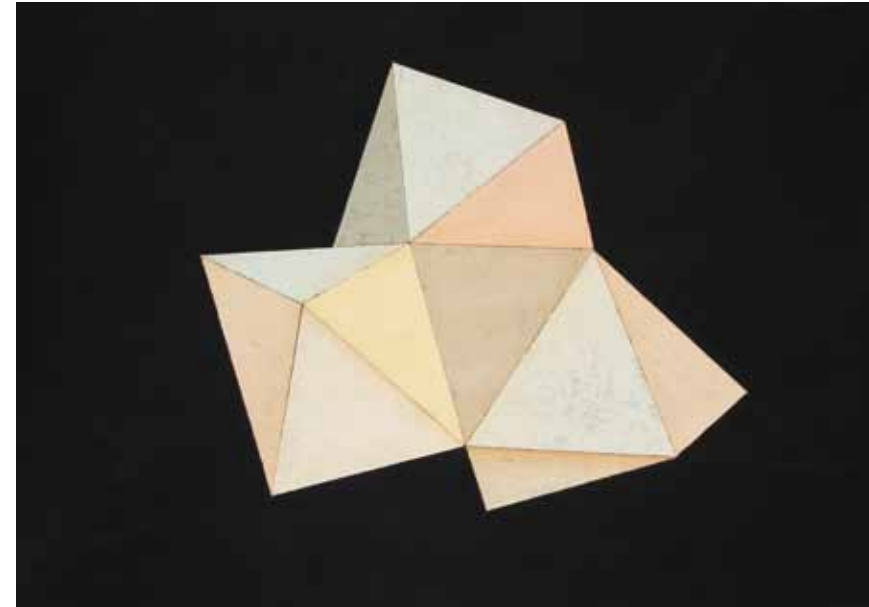
o.T., 2.09.2013 Mischtechnik / Décollage, 70 x 100 cm